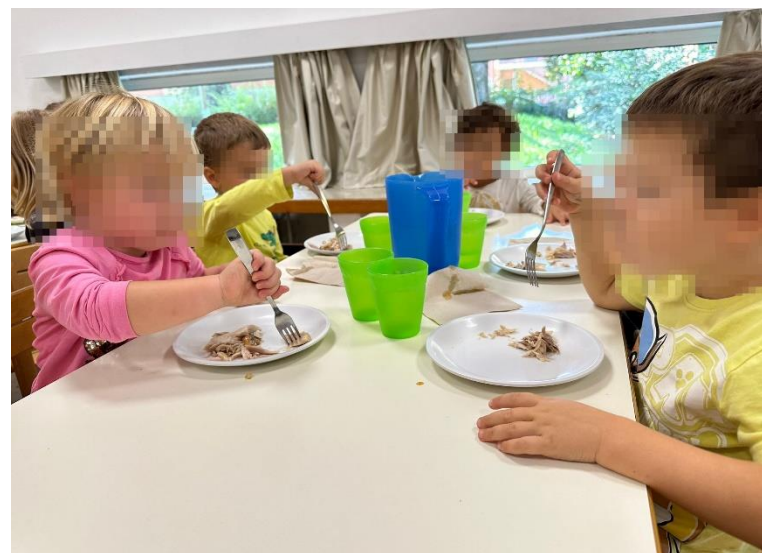
Il momento del pranzo in sezione