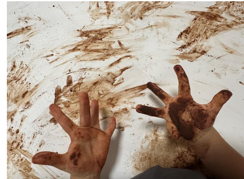
Esperienze in e...