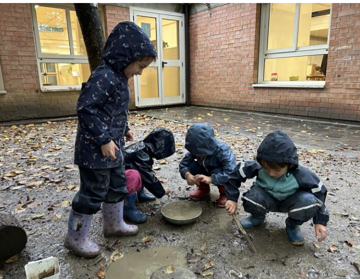
... out door