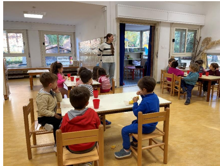
La colazione condivisa