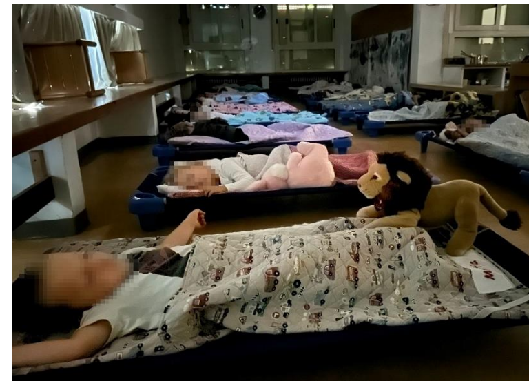
Il riposo pomeridiano per le sezioni dei 3 e 4 anni, mentre i 5 anni sono coinvolti in esperienze programmate o con gli esperti