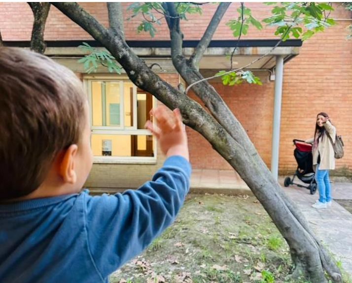
L'ingresso a scuola del mattino